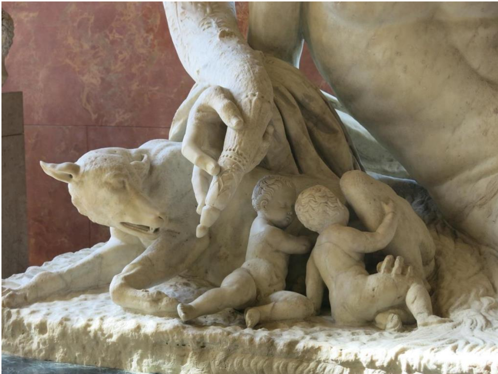
Romulus, Remus et la louve, détail de l'allégorie du Tibre (Paris, Musée du Louvre)